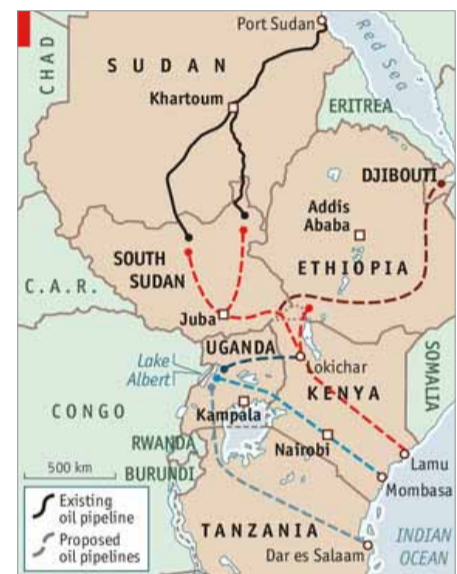
Karta över östra Afrika som visar några av alla de av Kina finansierade projekten på kontinenten.

För det andra är BRIKS-ländernas hela syn på ekonomi och ekonomiskt värde inte baserad på finansiellt värde eller pengar, utan, som Lyndon LaRouche definierar det,