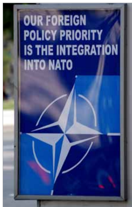
Ett valplakat för FP? Nej, den här gången var det från Georgien. Ryssland blir inringat, och gillar inte läget.

ligheten. Roosevelts idé med FN som ett fungerande forum för samarbete mellan nationalstater i Westfaliska fredens anda saboterades av den brittiska kallakrigspolitikerna. Det egentliga syftet med Nato för den cyniska brittiska geopolitiken formulerades av Lord Ismay, Natos förste generalsekreterare, som "att hålla ryssarna ute, amerikanerna inne och tyskarna nere" och kunde han tillagt, "britterna ovanpå".