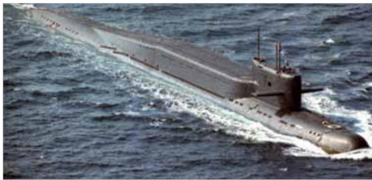
Vi får hoppas att de inte anser att denna måste användas.

tionerna och oljepriskriget mot Ryssland i Moskva ses som del av regimskifteåtgärden och inte kommer att tolereras. Agerandet sätter världen på randen till termonukleär utplåning. LaRouche: