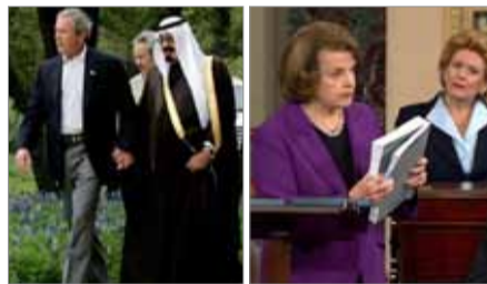
George W. Bush with King Abdullah Dianne Feinstein

The question is: Will this open up the floodgates to the full truth concerning another cover-up perpetrated by the Bush Administration and perpetuated by Obama? Namely, the redacted 28 pages of the Congressional Joint Inquiry report into activities of the US intelligence community before and following the 9/11 attacks? These 28 pages, which were classified by the Bush Administration and continue to be classified by