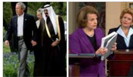
George W. Bush with King Abdullah Dianne Feinstein

The question is: Will this open up the floodgates to the full truth concerning another cover-up perpetrated by the Bush Administration and perpetuated by Obama? Namely, the redacted 28 pages of the Congressional Joint Inquiry report into activities of the US intelligence community before and following the 9/11 attacks? These 28 pages, which were classified by the Bush Administration and continue to be classified by