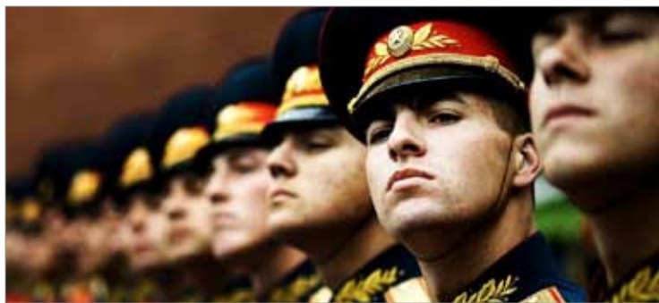
Ryssarna ser inte ut att backa.