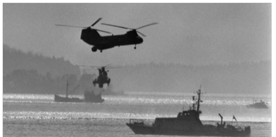
U-båtsjakt på 1980-talet. Den kapacitet vi hade då finns inte längre, men detta får inte användas som ett skäl att gå med i Nato eller för att eskalera krigsretoriken mot Ryssland om vi vill undvika krig.

Eftersom denna brittiska politik att härska genom att söndra dominerade hela Europa, drogs även Sverige in i kalla kriget. Östersjöområdet blockerades i årtionden och Sverige hamnade ekonomiskt i en av världens utkanter. Endast det ekonomiska sammanbrottet för kommunismen, folkens revolt i Östeuropa och murens fall avbröt kallakrigsordningen och öppnade Europas största chans till återförening och