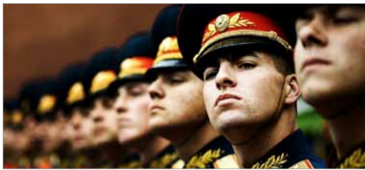
Ryssarna ser inte ut att backa.

Lyndon LaRouche anklagar britterna och president Obama för att genom sina ekonomiska krigshandlingar sätta världen på randen till riktigt krig. Ryska ledare från president Putin till utrikesminister Lavrov har tydliggjort att sank-