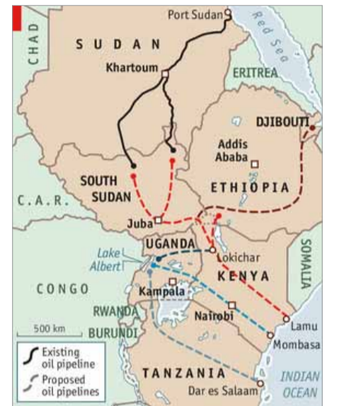
Karta över östra Afrika som visar några av alla de av Kina finansierade projekten på kontinenten.

För det andra är BRIKS-ländernas hela syn på ekonomi och ekonomiskt värde inte baserad på finansiellt värde eller pengar, utan, som Lyndon LaRouche definierar det,